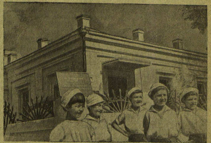
СМОЛЕНСК. Дом № 7 по улице Крупской, где летом 1919 года жил и работал И. В. Сталин. Сейчас в этом доме — детский сад.

★ ★ ★ # Ленинградская фабрика «Пролетарская победа» выпускает к осенне-зимнему сезону обувь новых моделей. Впервые изготавливаются туфли и полуботинки с прочным и непроницаемым верхом из капрона.